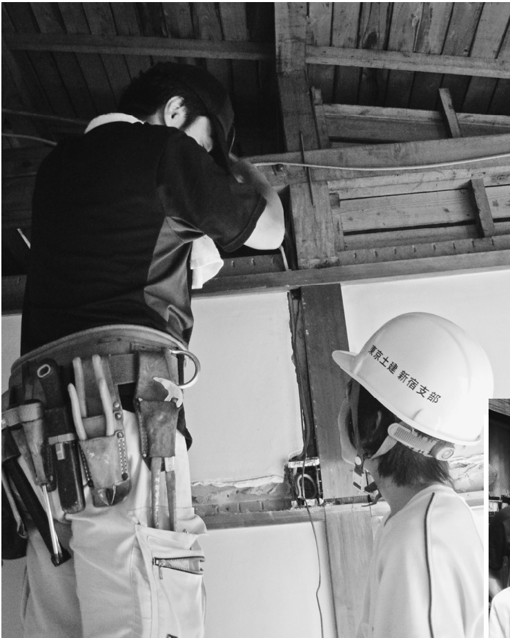
【熱心に職人の手際に見入る生徒】

楽しかったです。(宮崎) 2日目の設備工事が大変でした。立ちっぱなしになるのも大変。でも、電動ドリルや壁の壊しなどは面白かったです。