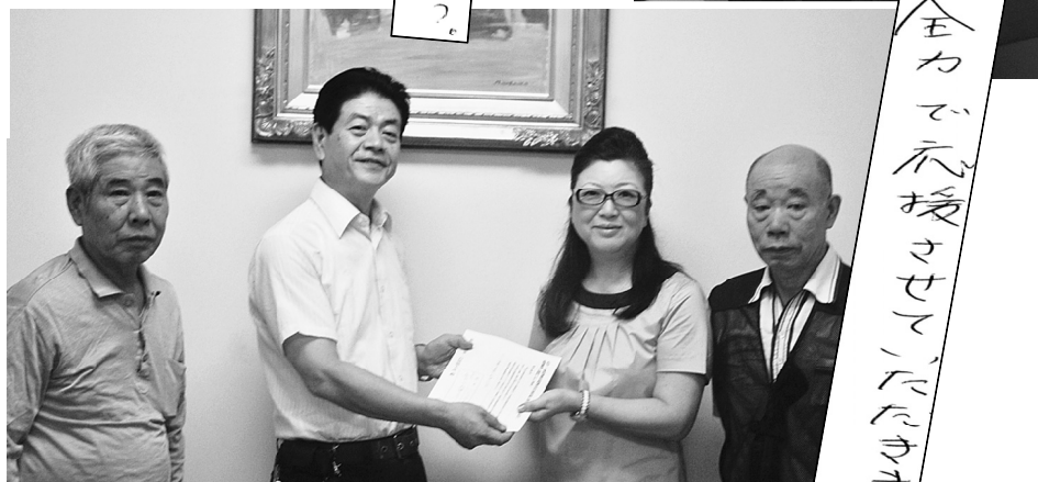
【民主党 いのつめまさみ議員】