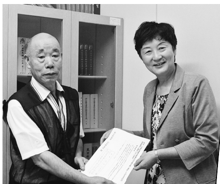
【日本共産党 大山とも子議員】