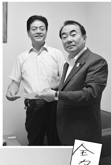
【公明党 よしぐら正義議員】