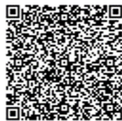
建築大工技能者検討会 ダウンロードQRコード

フリーランス新法が施工されたことを受け、本法の対象となりえる「中小工務店から一人親方の大工など個人事業主への発注」について、今後の対応を仲間知らせるチラシを、全建総連が事務局を担う「建築大工技能者検討会」が発行しました。