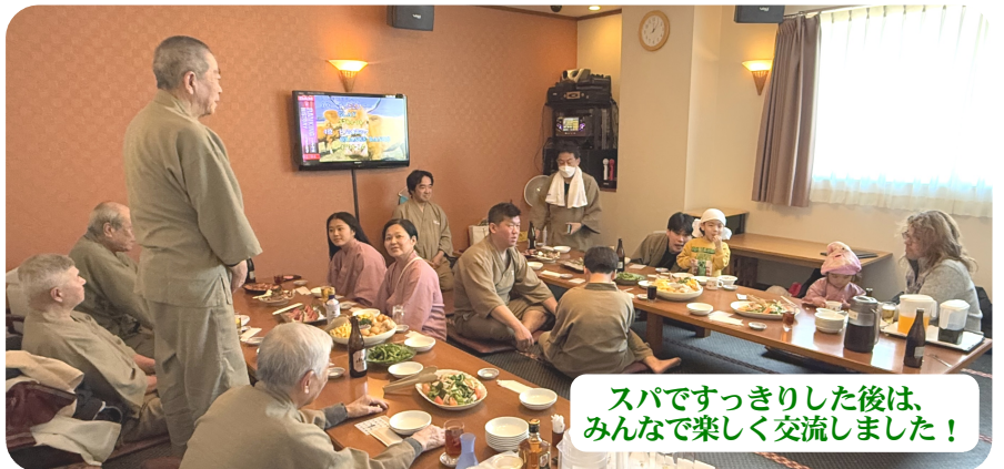
スパですっきりした後は、みんなで楽しく交流しました！

2月18日住宅センターの定例会議において今年4月から施工される4号特例についての講習会を実施しました。1級建築士・1級施工管理技士でもある我が支部委員長に講師をお願いし、要点を掻い摘んで分かりやすい説明をしていただく。詳細についてはHP等でご確認ください。