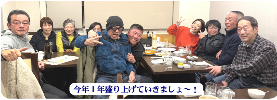
今年1年盛り上げていきましょ〜!