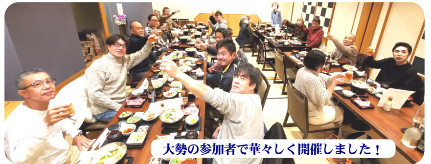
大勢の参加者で華々しく開催しました!