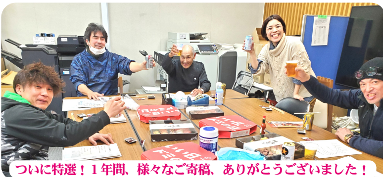
ついに特選! 1年間、様々なご寄稿、ありがとうございました!