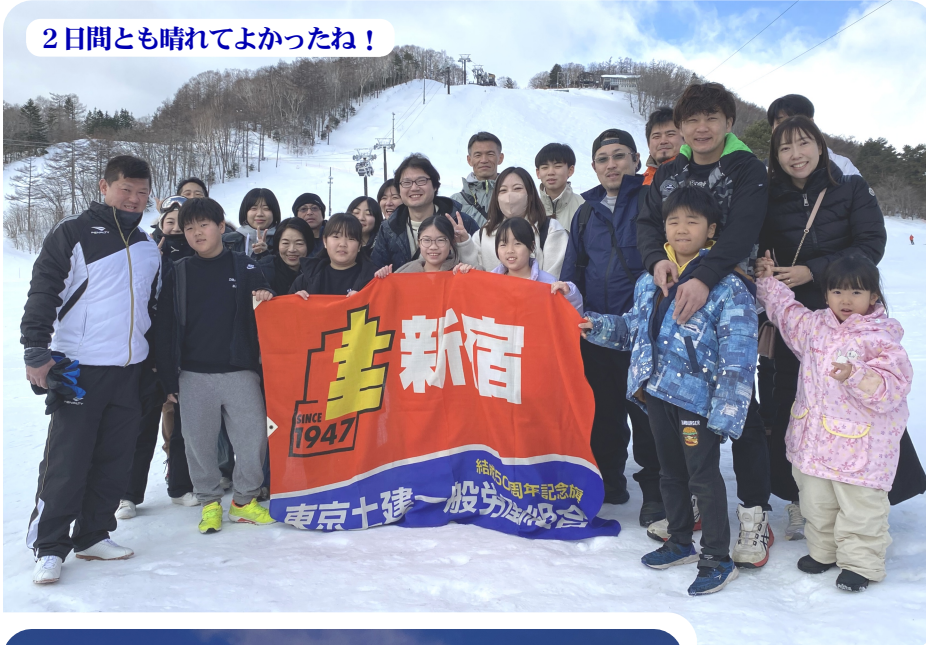
2日間とも晴れてよかったね！

編集・発行人 東京土建一般労働組合新宿支部 新宿区北新宿4-33-9新建ビル 電話03(3362)2161 Fax03(3362)2289 http://www.doken-shinjuku.jp E-mail: shinjuku@tokyo-doken.or.jp 定価1部 50円