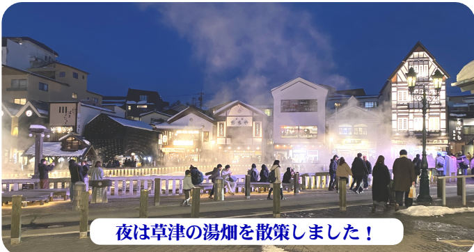
夜は草津の湯畑を散策しました！