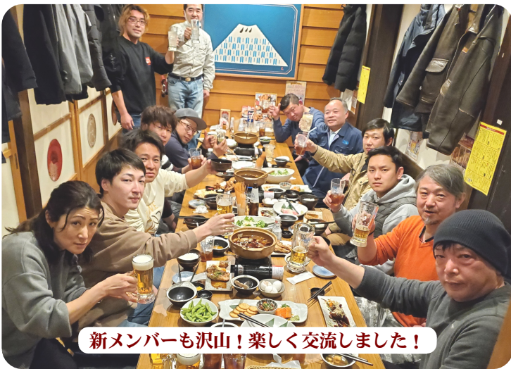
新メンバーも沢山！楽しく交流しました！

新都心分会では、3年目の「ミドルエイジ交流会」を、2月22日土曜日の夜19時から新大久保のミライザで開催し、13人が集まりました。「仕事関係・現場関係の情報交換でゆるく一杯やりませんか？」と20代から50代の組合員に呼び掛けました。日程が合わず参加はできなかったものの、 集まりに興味をもってくれた人も10人ほどいて、昨年参加したメンバーから「行きたかった〜年一回じゃなく、何回かできないですか？」という声もあがりました。 今年は、参加人数が多くなっても28才から50代後半まで幅広く、いろんな職種の人が集まり、自己紹介を一巡するのにも活気がありました。それぞれ