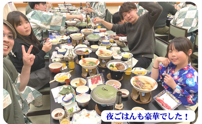
夜ごはんも豪華でした！

士で、皆、夜遅くまで交流し、今までの組合員同士の関係性をより深める事ができ、分会・群を超えた繋がりを活性化させるイベントとなりました。