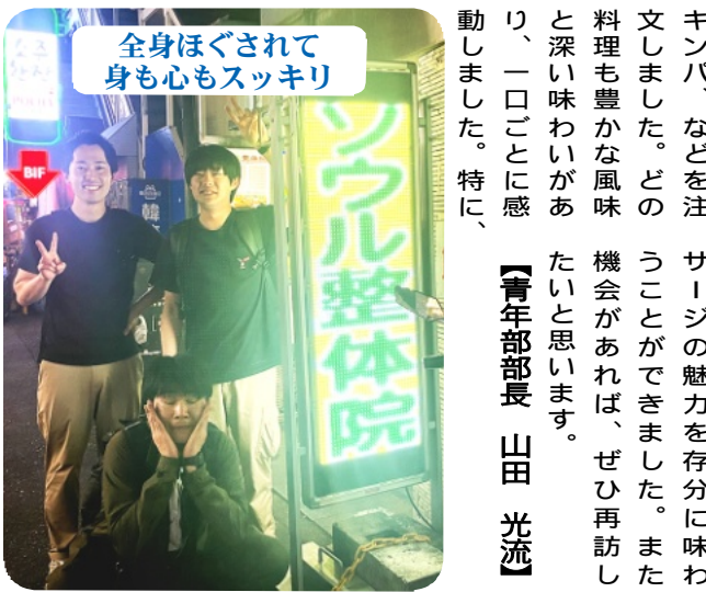
全身ほぐされて身も心もスッキリ

葉は散り肥やしとなりまたが根が育ちます。いつか大きな花を咲かすと信じて、来年の実行委員に託したいと思います。