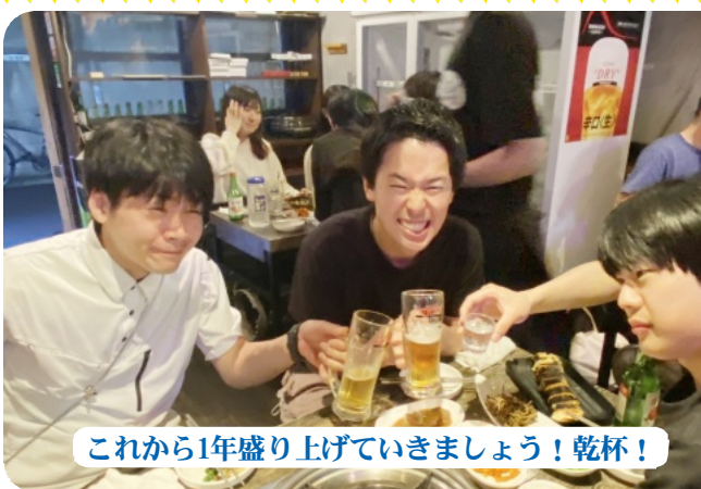
これから1年盛り上げていきましょう!乾杯!

かを踏まえて、注目されるはっば隊にしました。まずメーデーとは何かという事を知ってもらい、何か面白いことしてるなと思ってもらいたいと考えました。メーデーの歴史は長く続いていくのに関わらず、多くの人がメーデーの事を知らないで、面白くパレード化すれば子どもや大人まで1つの行事として楽しく見に来てくれて理解してもらえるのではないかと思います。制作中は参加した仲間が毎回楽しくしており、笑いが絶えなかったのが凄く良い思い出になりました。また、当日は物凄い雨で気温も下がり、このままでは土気まで下がるのではないかと思います。新宿支部のメンバーや他支部の仲間が楽しんでくれて、何より歩行者の方々が大きく手を振ってくれたことが嬉しかったです。