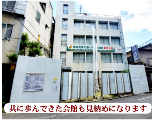
共に歩んできた会館も見納めになります

5月21日(火)に仮囲いが設置され、30日(木)からアスベスト除去工事が開始されました。除去工事が終わる次第、解体工事が始まります。