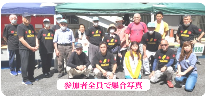
参加者全員で集合写真

計る機会が無いから、たくさんの方が大人も子どもも、自分の握力に興味があるみたいで、行列ができて午前中に景品が無くなる盛況振りでした。それと射的と子ども工作も反響