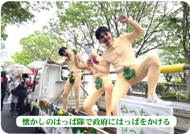
懐かしのはっば隊で政府にはっばをかける

今年のメーデーは何をテーマに作るかの前に、新宿会館の建て替えのために制作のスペースが確保できないとの事で始まりました。今年もデモ行進のみという案もありましたが、メーデー当日に組み立てが可能なもので考える事になり、会議は夜遅くまで話し合いを行い、多数の案からはっば隊になりました。はっば隊になった理由は政府に『発破(はっば)』をかけるという形で